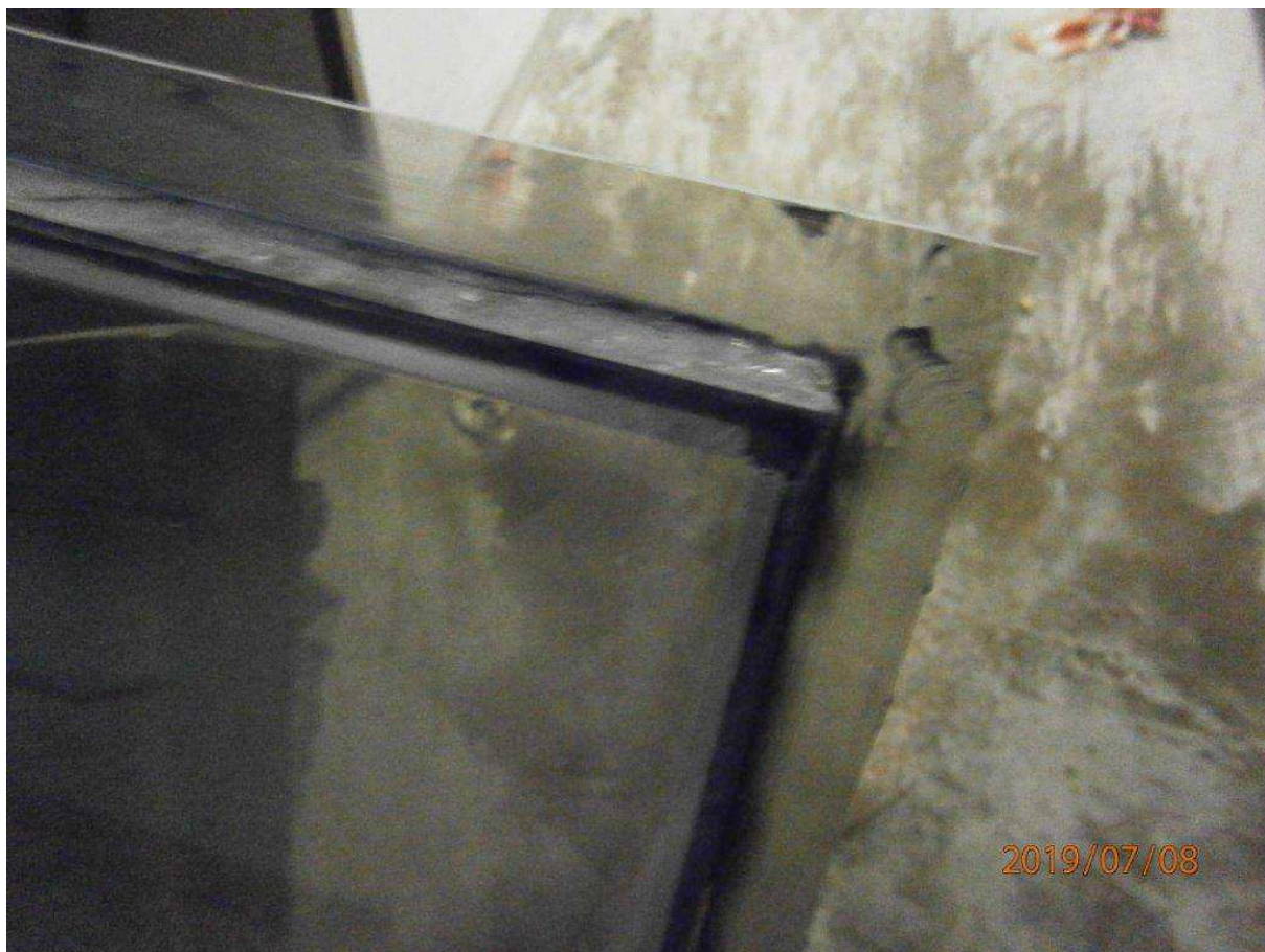
Zdjęcie fragmentu starej zdemontowanej szyby.