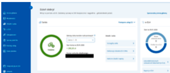
Strona główna portalu eZUS

Łatwiejsza będzie też wymiana korespondencji w tej samej sprawie, ponieważ będzie połączona w jeden wątek – podobnie jak w programach do obsługi e-maili. Dodatkowo dotychczasowa skrzynka odbiorcza będzie składała się z trzech sekcji: