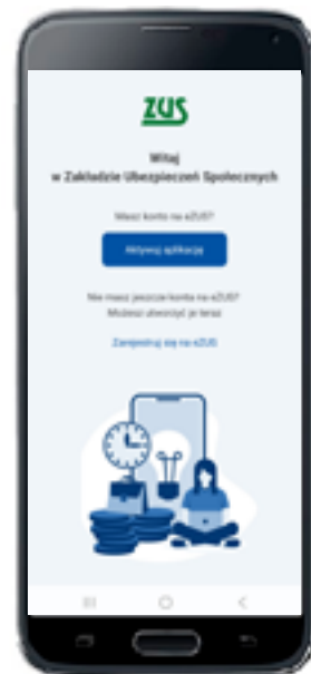
Widok strony głównej aplikacji mZUS

Wszystkie informacje na temat portalu eZUS oraz aplikacji mobilnej mZUS dla płatników składek będziemy publikować na naszej stronie internetowej www.zus.pl .