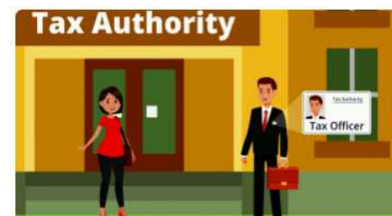
Kto pobiera podatki i dla...