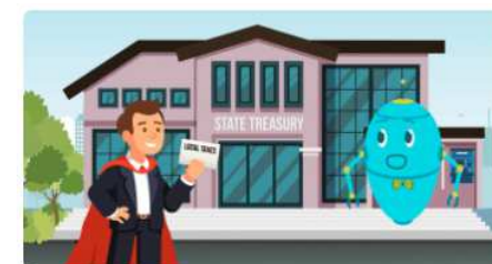
Kto płaci obecnie podatki...