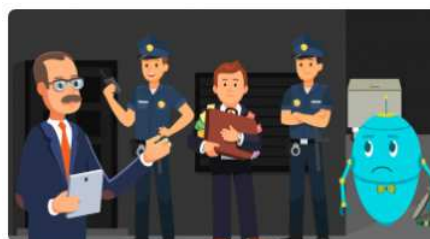
Co się stanie, jeżeli nie...