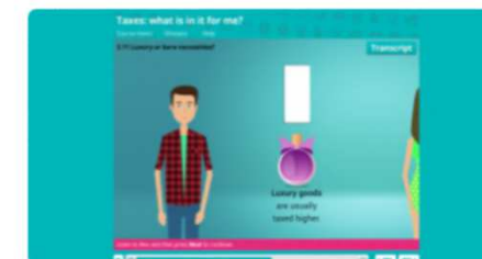
Podatki: co mogę z tego w...