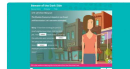
Strzeż się ciemnej strony