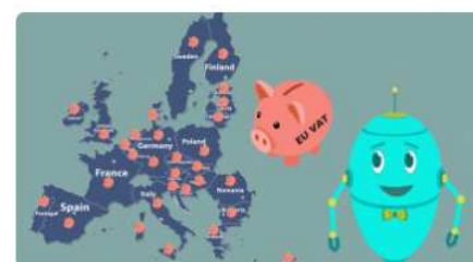
Podatek od wartości dodan...