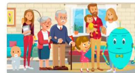
Jak to się stało, że wpro...