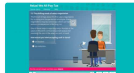
Tylko bez spinki! Wszyscy...